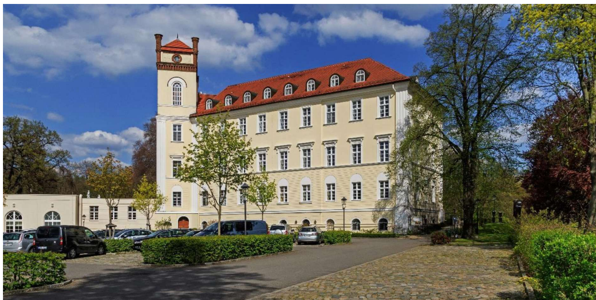
A.Savin (Wikimedia Commons · WikiPhotoSpace) - Eigenes Werk Schloss in Lübbenau/Spreewald, Brandenburg, Deutschland

Deutscher Stenografenbund E. V. Brackeler Hellweg 124 44309 Dortmund Tel. 0231 13767976 Fax 0231 149394 E-Mail info@stenografenbund.de