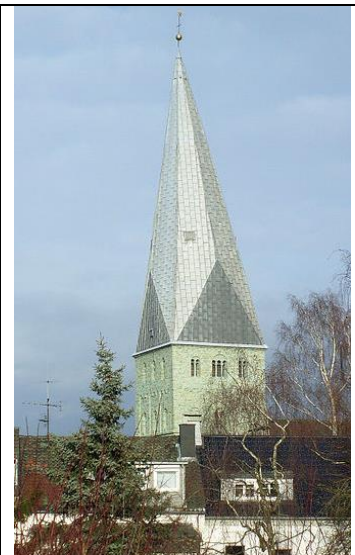
Pauluskirche in Kamen